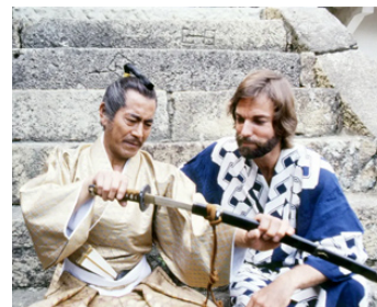
1980 SHOGUN (Shogun) de Jerry London avec Richard Chamberlain