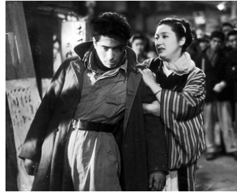
1950 ÉVASION (Datsuyoku) de Kajiro Yamamoto avec Mieko Takamine