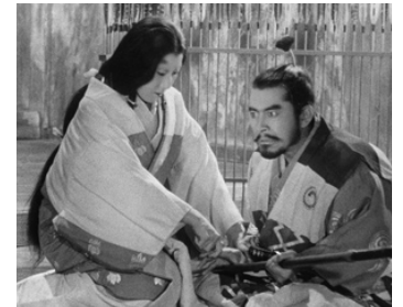
1957 LE CHÂTEAU DE L'ARAIGNÉE (Kumonoso jo) d' Akira Kurosawa avec Isuzu Yamada