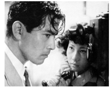
1949 LE CHIEN ENRAGÉ (Nora inu) d' Akira Kurosawa avec Keiko Awaji