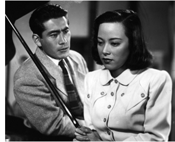
1950 LE SCANDALE (Shubun) d' Akira Kurosawa avec Shirley Yamaguchi