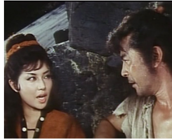
1963 LE GRAND BANDIT ((Daitozoku) de Senkichi Taniguchi avec Tadao Nakamura