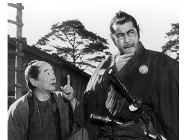
1961 YOJIMBO, LE GARDE DU CORPS (Yojimbo) d' Akira Kurosawa avec Atsushi Watanabe