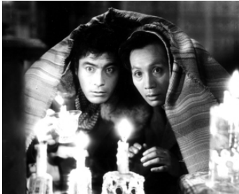
1951 L'IDIOT (Hakuchi) d' Akira Kurosawa avec Masayuki Mori