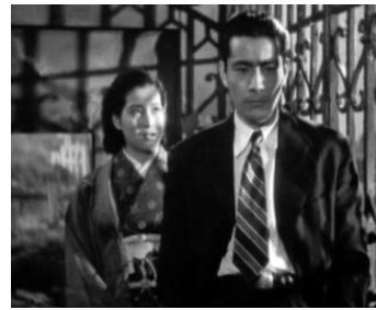
1948 LE DUEL SILENCIEUX (Shizukanaru ketto) d' Akira Kurosawa avec Miki Sanjo