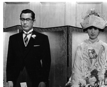
1960 LES SALAUDS DORMENT EN PAIX (Warui yatsu) d' A. Kurosawa avec Kyoko Kagawa