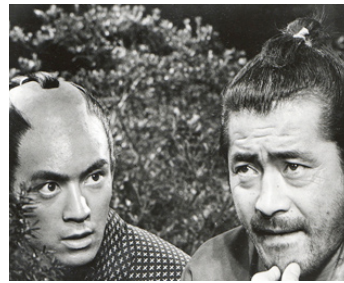
1962 SANJURO (Tsubaki Sanjūrō) d'Akira Kurosawa avec Tatsuya Nakadai