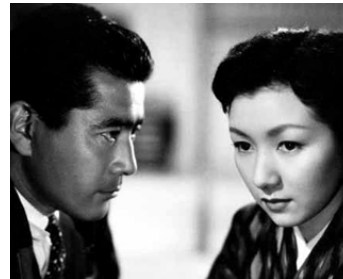
1956 LE CŒUR DE LA FEMME (Tsuma no kokoro) de Mikio Naruse avec Hideko Takamine