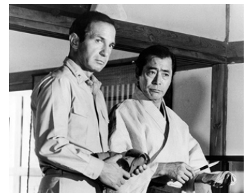
1981 INCHON ! (Inchon !) de Terence Young avec Ben Gazzara