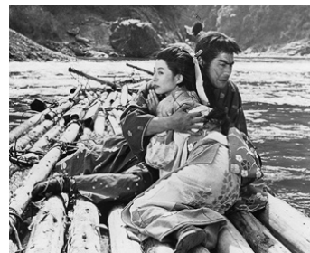
1957 CARNET DES ARTS MARTIAUX (Yagyû bucheicho) d' H. Inagaki avec Noboku Otowa