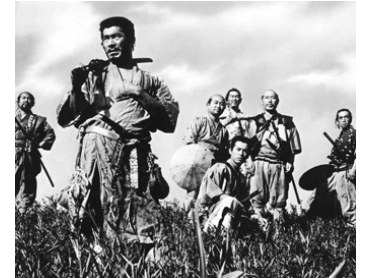
1953 LES SEPT SAMOURAÏS (Shichinin no samurai) d' Akira Kurosawa