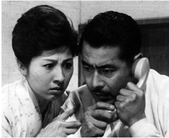
1963 ENTRE LE CIEL ET L'ENFER (Tengoku to jigoku) d'Akira Kurosawa avec Kyoko Kagawa