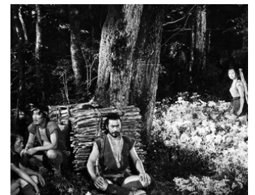
1958 LA FORTERESSE CACHÉE (Kakushi toride) d' Akira Kurosawa avec Misa Uehara