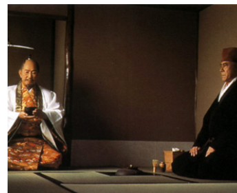
1989 LA MORT D'UN MAÎTRE DE THÉ (Sen no rikyu) de Kei Kumai avec Eijo Okuda