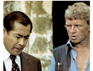
1973 LE TIGRE DE PAPIER (Paper Tiger) de Ken Annakin avec Hardy Krüger