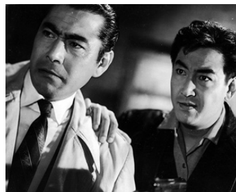
1960 LE BOSS DES BAS-FONDS (Ankokuga no taiketsu) de K. Okamoto avec K. Tsuruta