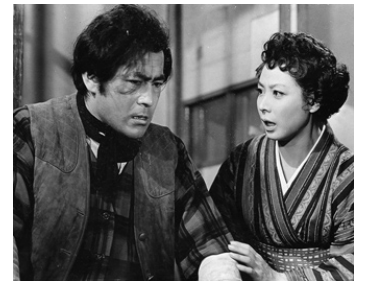
1962 TATSU LE SOÛLARD (Doburoku no Tatsu) d'Hiroshi Inagaki avec Sonomi Nakajima