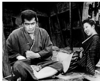
1957 LES BAS-FONDS (Donzoko) d' Akira Kurosawa avec Isuzu Yamada