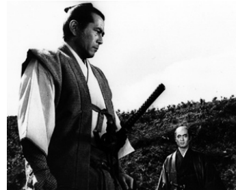
1967 REBELLION (Joi uchi, Hairyo tsumo shimatsu) de Masaki Kobayashi avec Tatsuya Nakadai