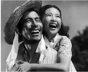
1950 LE PROFESSEUR ISHINAKA (Ishinaka sensei gyogyoki) de Mikio Naruse avec Yuji Hori