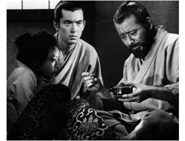
1964 BARBEROUSSE (Akahige) d'Akira Kurosawa avec Yuzo Kayawa, Miyoko Nakamura