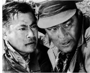
1963 L'HÉRITAGE DES 500 000 (Gojuman nin no isan) de Toshiro Mifune avec Tatsuya Nakadai