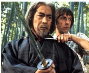
1982 À ARMES ÉGALES (The Challenge) de John Frankenheimer avec Scott Glenn