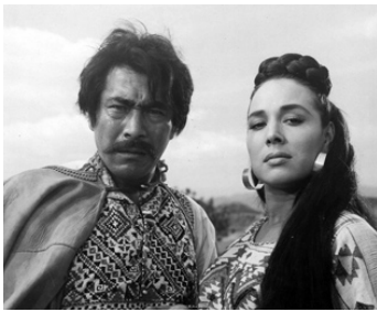
1961 L'HOMME IMPORTANT (Animas Trujano) d'Ismael Rodriguez avec Columba Dominguez