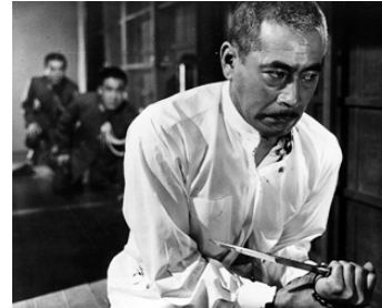
1967 L'EMPEREUR ET LE GÉNÉRAL (Nihon no ichiban nagai hi) d'Hihachi Okamoto