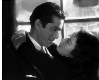
1953 L'ÉTREINTE (Hoyo) de Masahiro Makino avec Shirley Yamaguchi