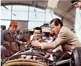
1966 GRAND PRIX (Grand Prix) de John Frankenheimer avec James Garner