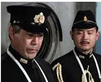
1976 LA BATAILLE DE MIDWAY (The Battle of Midway) de Jack Smight avec James Shigeta