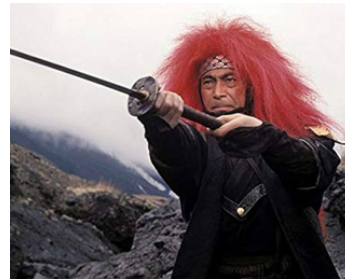
1969 LES CHEVEUX ROUX (Akage) de Kihachi Okamoto