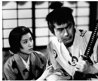
1961 LE CHÂTEAU D'OSAKA (Osaka jo monogatari) d'Hiroshi Inagaki avec Kyoko Kagawa