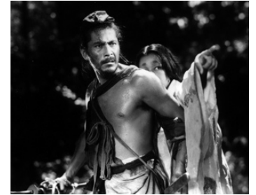
1950 RASHOMON (Rashômon) d' Akira Kurosawa avec Machiko Kyo