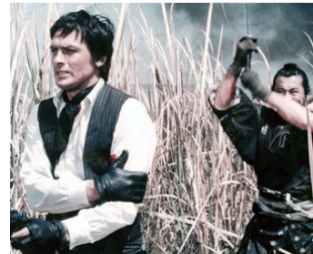
1971 SOLEIL ROUGE (Red Sun) de Terence Young avec Alain Delon