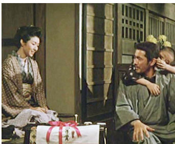
1958 L'HOMME AU POUSSE-POUSSE (Muhomatsu no issho) d' Hiroshi Inagaki