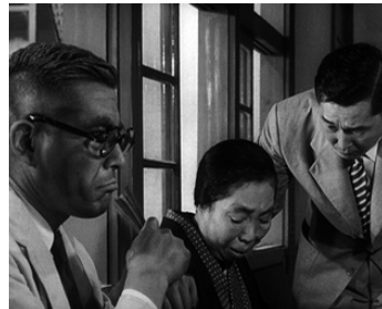
1955 VIVRE DANS LA PEUR (Ikimono no kiroku) d' A. Kurosawa avec Saoko Yonemura, T. Shimura