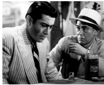
1948 L'ANGE IVRE (Yoidore tenshi) d' Akira Kurosawa avec Reizaburo Yamamoto