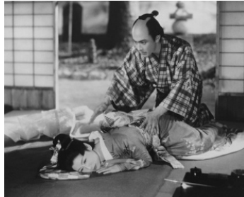
1952 LA VIE D'O'HARU FEMME GALANTE (Saikaku ichidai onna) de K. Mizoguchi avec Kinuyo Tanaka