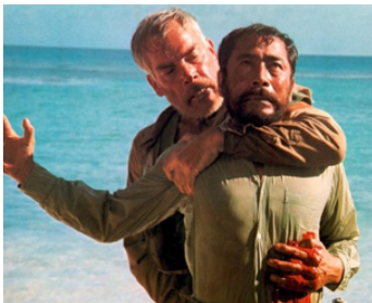
1968 DUEL DANS LE PACIFIQUE (Hell in the Pacific) de John Boorman avec Lee Marvin