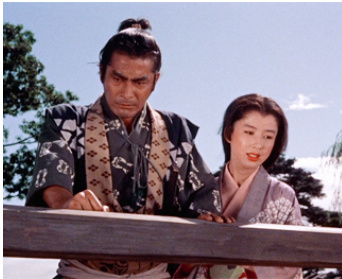
1954 LA LÉGENDE DE MUSACHI (Miyamoto Musachi) d' H. Inagaki avec Mitsuko Mito